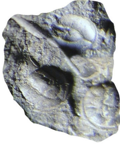
Trilobiten Agnostus pisiformis var liten, ofta under 1 cm lång. Den var väldigt vanlig och det finns fossil av den i Närke, Västergötland, Skåne och på Öland.