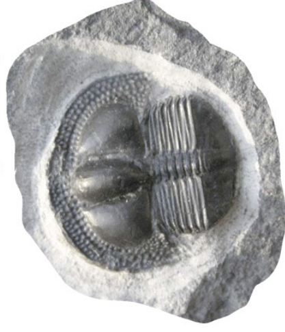
Trilobiten Tretaspis hade långa bakåtgående spröt på sin huvudsköld, men dessa finns sällan kvar i fossilen. Tretaspis har hittats i Västergötland.